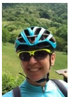
Roberta Travel booking